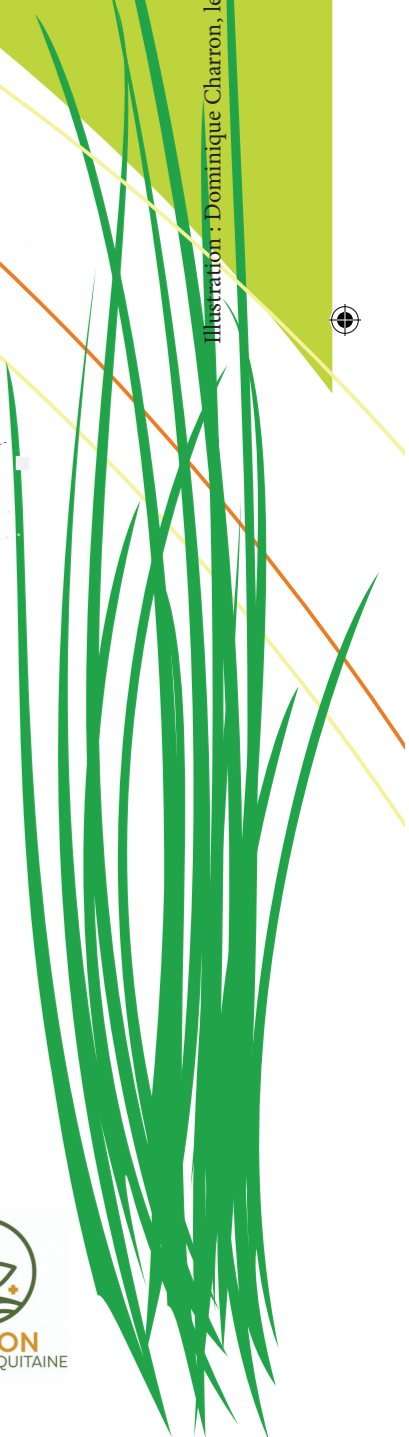
Illustration : Dominique Charron, le toit à vaches (exposition Zéro Pesticide de Loiret Nature Environnement)